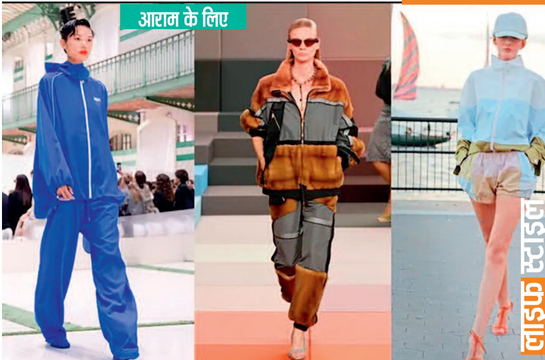
आराम के लिए

आकांक्षा पुरी इन दिनों खेसारी लाल यादव के साथ खूब भोजपुरी फिल्मों और गाने कर रही हैं। अब उन्होंने एक वीडियो शेयर किया है, जिसमें वह खेसारी के साथ शूट के दौरान रोमांटिक होती नजर आ रही हैं। वीडियो देख यूजर्स हैरान हैं और कमेंट्स कर रहे हैं। देखिए वीडियो और पहिए यूजर्स क्या बोले: इन दिनों भोजपुरी में खेसारी लाल यादव और आकांक्षा पुरी की जोड़ी का जलवा देखने को मिल रहा है। दोनों साथ में न सिर्फ फिल्में कर रहे हैं, बल्कि कई गाने भी कर चुके हैं और कर रहे हैं। आकांक्षा पुरी और खेसारी अब जल्द ही एक और गाने में नजर आएंगे, जिसके शूट का वीडियो एक्ट्रेस ने सोशल मीडिया पर शेयर किया है। वीडियो में आकांक्षा और खेसारी के बीच रोमांटिक एंगल शूट किया जा रहा है। आकांक्षा सीन में खेसारी से लिपटी नजर आ रही हैं। इस पर यूजर्स के काफी कमेंट्स आ रहे हैं। आकांक्षा पुरी ने यह वीडियो अपने इंस्टाग्राम अकाउंट पर शेयर किया है, और फैंस के बीच सुर्खियां बटोर रहा है। एक यूजर ने लिखा है, ‘क्या जोड़ी है खेसारी भैया!’ एक बोला, ‘आकांक्षा भाभी आई लव यू!’ एक ने लिखा, ‘सुपरस्टार खेसारी लाल यादव जी और आकांक्षा पुरी जी का जोड़ी बवाल मचा रखी है।’ एक यूजर ने कमेंट किया, ‘आग लगा दी!’ एक बोला, ‘बहुत ही खतरनाक!’ मालूम हो कि आकांक्षा पुरी और खेसारी लाल यादव हाल ही फिल्म ‘अग्निपरीक्षा’ में नजर आए।